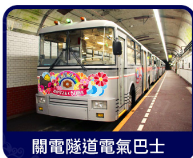
關電隧道電氣巴士