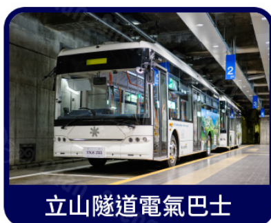
立山隧道電氣巴士