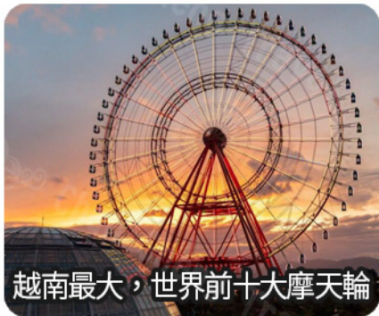
越南最大，世界前十大摩天輪

是一個非凡的遊樂園和海濱水上樂園，坐落在世界上最令人嘆為觀止的海灣之一，是越南著名的主題公園。從本島出發，乘芽莊纜車或快艇到VinWonders並欣賞沿途美麗景色。園區中可以體驗各種遊樂設施與花園景觀，是休閒娛樂的最佳聖地。