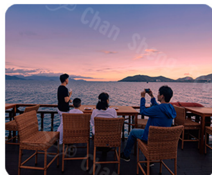
甲板上的美麗景觀