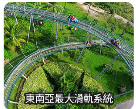
東南亞最大滑軌系統