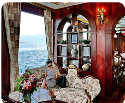
尊榮高貴的遊輪內部