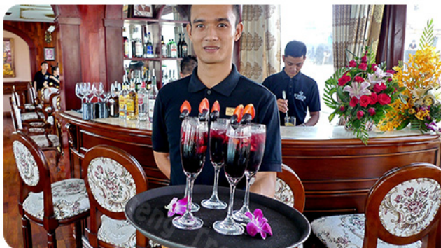
美妙和涼快的雞尾酒

皇帝遊輪的感性來自越南最後一位皇帝保大王的精緻生活。目標是為遊客提供皇帝或皇后般的服務，享受包括音樂、藝術、建築、文化、美食、歷史和戶外活動。一邊觀賞風景一邊享受在船上音樂，飲料，新鮮的水果，團體表演的節目。